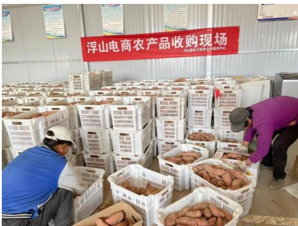
浮山县电商公共服务中心（发）